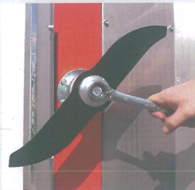
NÓŻ do cięcia gałęzi o średnicy do 2 \div 3 cm