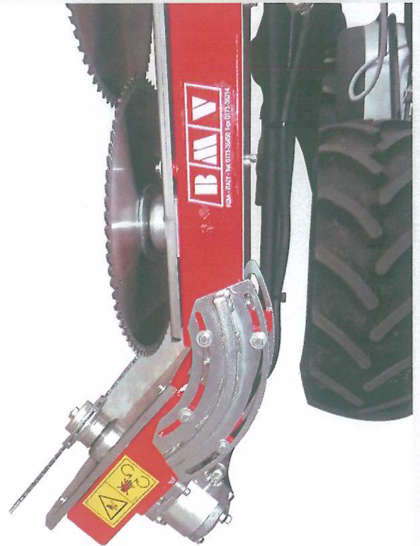
REGULOWANY DOLNY ZESPÓŁ TNĄCY 0 \div 90^\circ